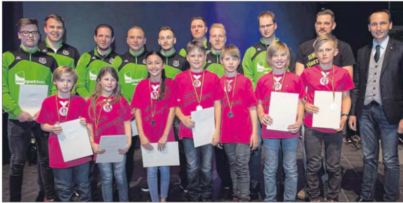
In jeder Hinsicht gut aufgestellt: Die Rollhockey-Spieler des SK Germania Herringen überzeugten 2017 als Pokalsieger, aber auch im Nachwuchsbereich mit dem zweiten Platz bei der deutschen U11-Meisterschaft.