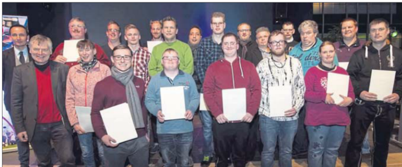
Die Sportler der Lebenshilfe Hamm für Menschen mit geistiger Behinderung gehören seit vielen Jahren zu den Stammgästen bei der Ehrung durch die Stadt.