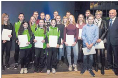
Zu Land, zu Wasser oder in der Luft: Die Sportler kamen aus insgesamt 17 verschiedenen Vereinen.