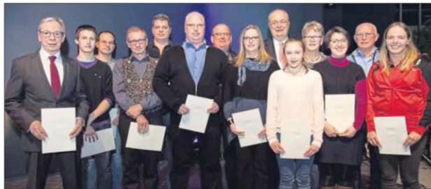
Zahlreiche Mitglieder der Schießgesellschaft Hamm nahmen in der Aula ihre verdienten Auszeichnungen entgegen.