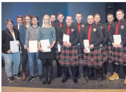
Stileich im Schottenrock kamen die Mitglieder der „Clan Dragon Fighters Hamm“.